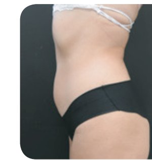
Après 1 mois