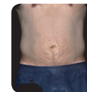
Après 1 mois