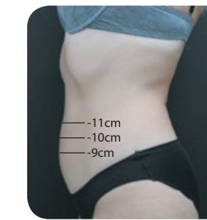
Après 3 mois